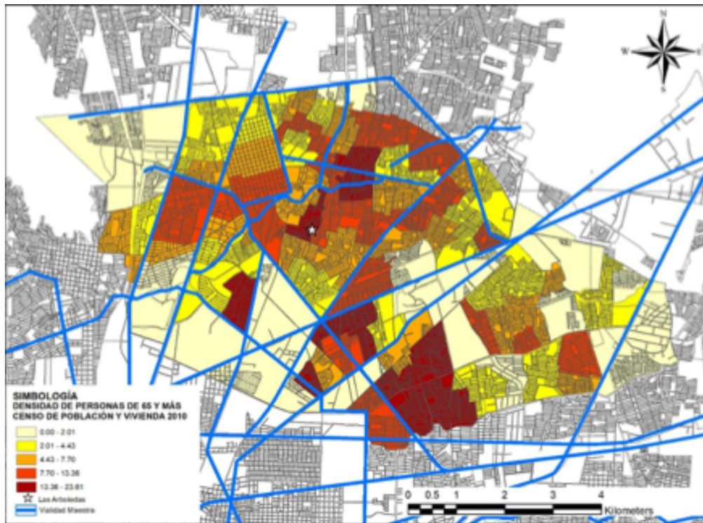
Mapa 1. Densidad de personas por hectárea del segmento demográfico de 65 años y más (2010) y localización del parque Las Arboledas