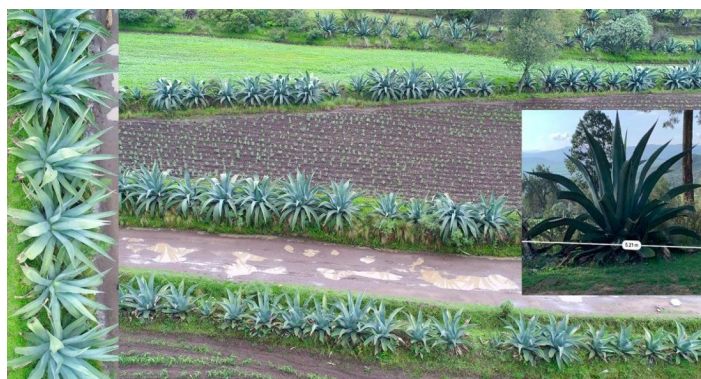
Imagen 3. Vista de magueyera y metepantles en Villalta

FUENTE: elaboración propia, con dron Phantom 4 Pro. Día de vuelo: 25 de junio de 2019.