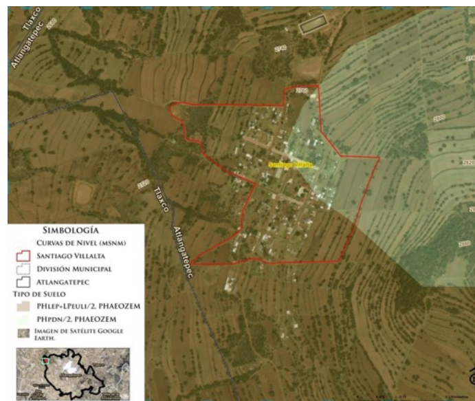
Mapa 2. Tipo de suelo en el espacio de Villalta