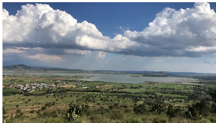
Imagen 2. Vista desde zonas altas en la región pulquera

Los suelos de Villalta están compuestos por andosoles, cambisoles, feozem y litosoles, lo que provoca diversidad de zonas con erosión; además, se suma a la pendiente en gran parte de la región de Villalta. Esa condición permite apreciar imponentes metepantles que cumplen la importante función de reducir los niveles de erosión. Así es como lo físico (relieve, humedad, clima y tipo de suelo) y humano (cultura del metepantle) se reúnen en el mismo espacio social, ahí la geografía adquiere singular valor, porque se enraíza históricamente, pervive, permanece en la cotidianidad (Mendoza, 2013).