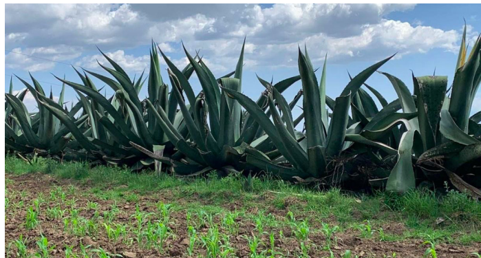
Imagen 5. Magueyes para extraer el aguamiel