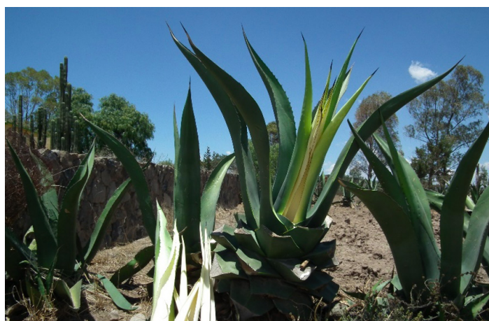
Imagen 8. Capado y preparado del maguey

Además de algunas ventajas del mercado como la anterior, la actividad ha tenido momentos de apoyo por parte del gobierno del estado de Tlaxcala, en el sexenio del gobernador Mariano González Zarur (2011-2017), a los productores les otorgaron ocho pesos por cada maguey sembrado (señala el informante), lo que hacían para recibir el apoyo económico era resembrar los hijuelos que nacen a un costado de los magueyes de mayor tamaño. Además del cuidado, también deben realizar el proceso de capado y conservación del aguamiel en espacios de adobe.