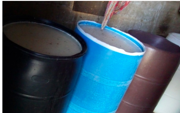
Imagen 4. Venta de pulque tierno, medio y fuerte