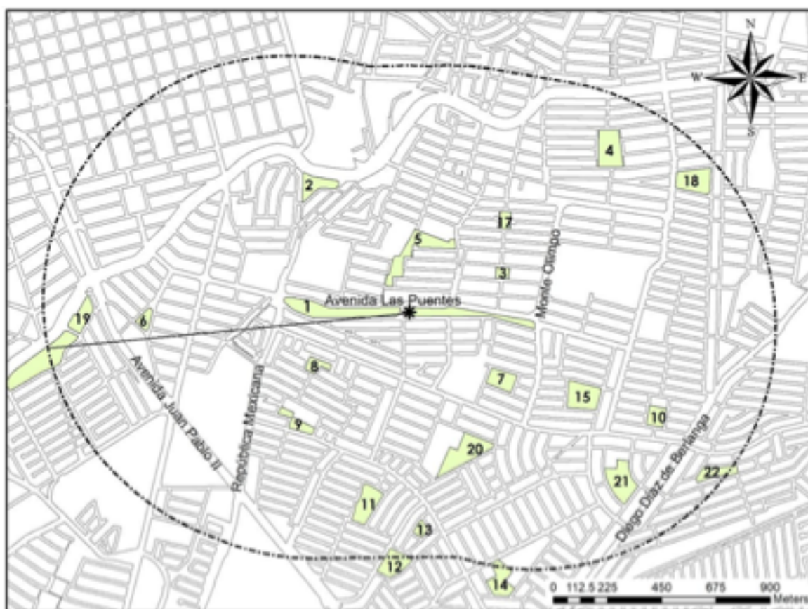
Mapa 2. Localización del parque Las Arboledas y de espacios públicos abiertos, situados a 1 km a la redonda