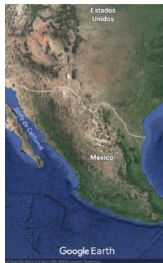
Figura 1. Ubicación de Ciudad Juárez en la frontera México-Estados Unidos

Esta industria irrumpió en los años sesenta absorbiendo enormes cantidades de personas, principalmente en condiciones de vulnerabilidad, para ser integradas a las cadenas de producción en masa. Esto provocó, por generaciones, la necesidad de tener a la mano a poblaciones sin educación, en situaciones de vulnerabilidad, provenientes del interior del país o de Centroamérica, sin redes en la ciudad, y con necesidades de adquirir un trabajo inmediato, con salarios deplorables y condiciones laborales precarias.