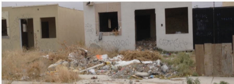
Figura 6. Casas abandonadas con alta concentración de basura