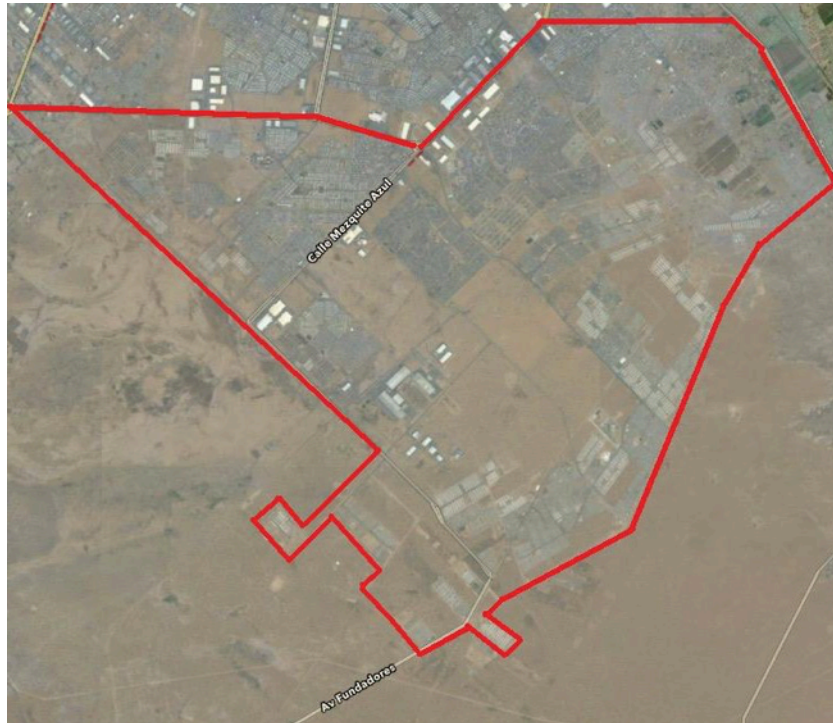
Figura 4. Delimitación del polígono suroriente