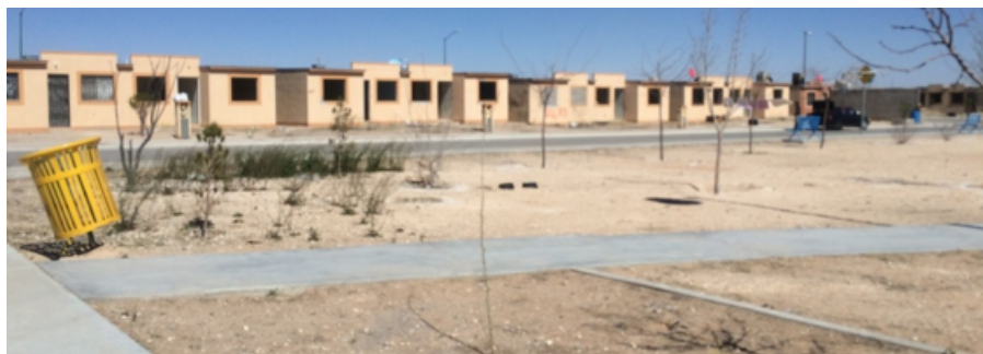
Figura 5. Casas abandonadas y parque descuidado

Estos siete casos no son lo más representativos en cuanto a su capacidad de organización y acción política, o vinculación subyacente con el Estado, pero sí sirven para extender un abanico de diversas formas de expresión que permiten contrastar y comparar casos distintos que se encuentran en condiciones espaciales y estructurales similares. Cada caso desarrolla formas de negociación distintas dentro de sus comunidades, discursos, vinculaciones con los aparatos del Estado y diferentes agendas a partir de condiciones como el grado de aislamiento, los servicios públicos que carecen, el número de