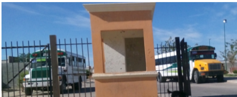
Figura 7. Casetas de seguridad abandonadas